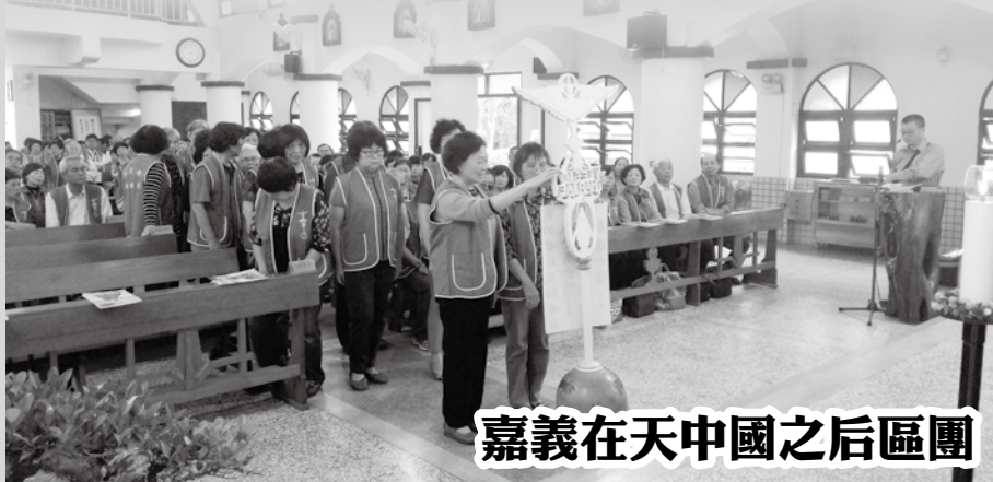
嘉義在天中國之后區團

「我的女皇，我的母親，我全屬於妳，我所有的一切，都屬於妳」讓我們把自己的奉獻和精神的禮物都放在慈母的手中！