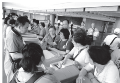
27日彩排時同心合力整理大會的手冊及紀念品打包