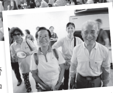
82歲的團員，服務不落人後