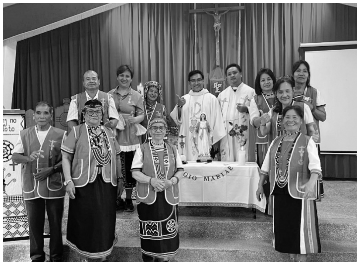
2024/04/27 花蓮教區 進教之佑區團 ◎蘭嶼新支團：救世之母支團<9 位團員>◎