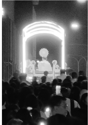
6/1晚上的聖體光遊行