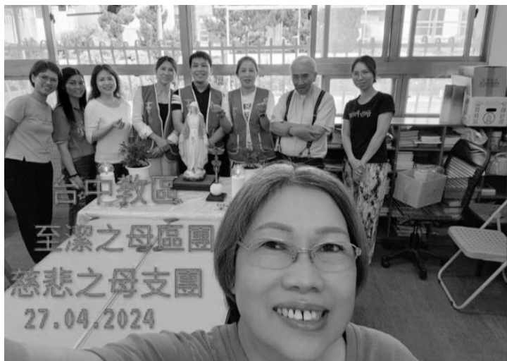
2024/04/27 台中教區 至潔之母區團 ◎台中新支團：慈悲之母支團◎