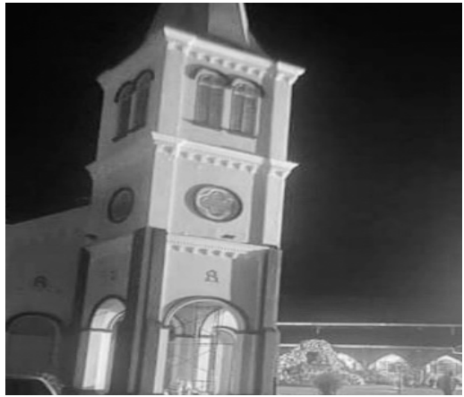
安順聖安多尼百年教堂(晚上抵達)

過早餐，我們兩部遊覽車共 66 位聖母的好兒女，浩浩蕩蕩的出發，來到聖米高教堂參加彌撒並和當地聖母軍（永援之母）做交流，她們的熱情和美食招待，讓我倍感親切，縱使是第一次的相見，卻有久違老友再次重逢的喜悅，她們的熱情盛意直把「有朋自遠方來、不亦樂乎」表達到極致！這種熱情，除了聖母軍可能很難再見。