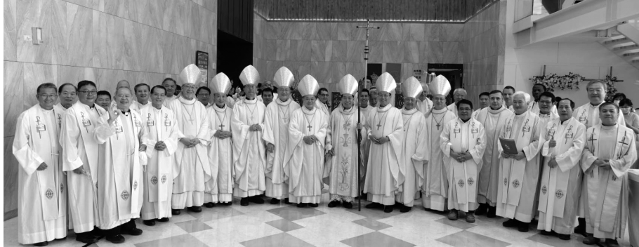
九位主教與教廷駐華代辦和共祭神父們

華馬德範代辦，共十位神長，十全十美。我們齊聚在福爾摩沙遊艇酒店，我們不是在慶祝金慶、銀慶、周年慶，我們是在舉行福傳四百、百人集體入門聖事，包括聖洗聖事、聖體聖事和堅振聖事。「福傳」是復活的主耶穌在升天前託付給我們的使命，我們要走出去，引領更多的人來認識救主耶穌，祂是我們的道路、真理和生命。