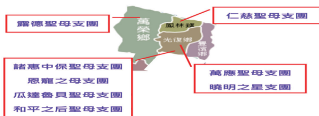
結約之櫃服務區域