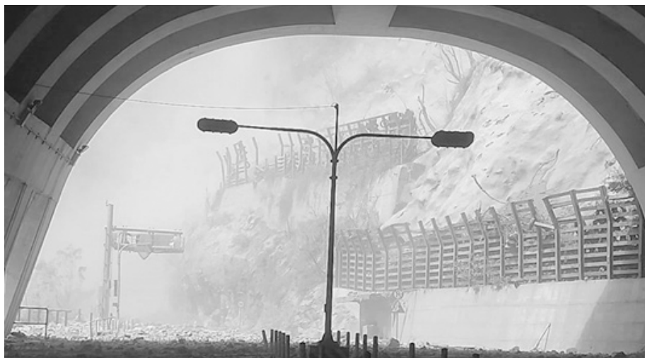
九曲洞步道入口處

結果，那位外國人大概在 2~3 小時後，滿身是土及血的從步道裡爬出來，在他的鼻樑處有裂開的傷口，當時的他顯得相當驚恐，後來經由在旁的晶英酒店資訊人員協助翻譯，請他先去清洗傷口、再由我來協助敷藥包紮傷口。在這其中，我也協助了其他的傷者處理及包紮傷口，也有的是扭到腳，而我也剛好有「一條根藥膏」，可以讓傷者感受到涼意後，就有舒緩的作用。（待續～ 52 期軍刊）