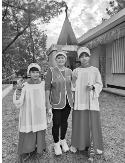
淑華外孫(左)、淑華(中)、淑華 外孫女(右)

地震發生時，她正騎機車前往太魯閣國家公園九曲洞入口處，（以下由第 1 人稱來敘述）剛進入九曲洞隧道口剎那間（1-2 秒間）聽到巨響在我身後，迴音在山谷中不停的繚繞，那時我並沒有覺察到是地震，以為是中國大陸攻打台灣，砲彈打在山壁而有的聲響，墜道內的場景是灰暗一片（沒有燈光）只剩我孤身一人（機車是唯一的燈光）的情境，黑暗伴隨著塵土深手不見五指讓我莫名的驚慌失措，當時恐懼到只剩下心臟不停的跳動，驚嚇到呆住了一陣子，停下機車默默的在心裡祈禱，口中不停的默唸著「天主保佑、天主保佑…天主求祢保佑我」，儘管如此～漫天哄哄哄哄的聲音仍不停的在作響，當我情緒稍微調整好後，我騎著機車往墜道內騎近 100 公尺，洞內灰塵瀰漫、空氣布滿塵土、呼吸困難也完全看不到，還好平常在這裡工作，熟悉裡面有二處通風口，在那裡才會有新鮮的空氣及陽光，可以看到外面的世界。