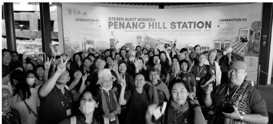
升旗山纜車站合影