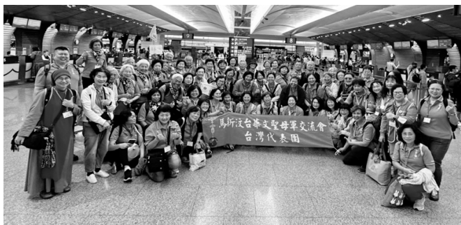
5/28台灣代表團66人，台灣桃園機場合影，預備搭機起飛