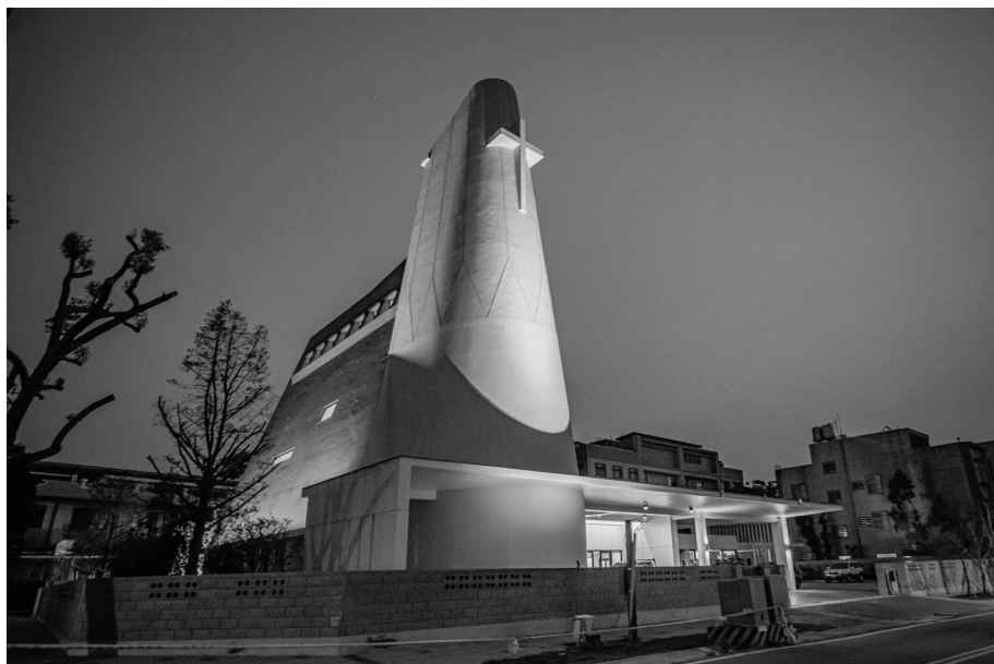
苗栗公館保祿堂夜景

檢閱典禮雖已完畢，對聖母軍團員、支團、區團是年度的總體成果檢驗、心靈的再整頓鼓舞，整裝迎接成長進入新的年度。祝福我們的團隊，在聖母領導下永遠效忠聖母！