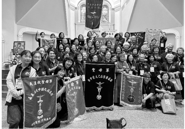
5/31 交流會開幕式彌撒後，台灣代表團於加影聖家堂祭台前合影

第四天，來到交流會開幕會場：【吉隆坡加影聖家堂】，彌撒開始，由馬來西亞新加坡汶萊台灣和澳門香港等，各地軍旗陸續進場，陣容是如此的雄壯浩大，在