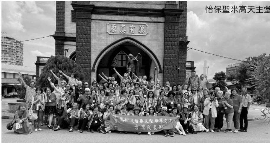
怡保聖米高天主堂

三場講座，更堅定了我們的信心，燃起我們的熱火， 聖母軍是聖化自己的捷徑，成聖自己，才能聖化他人啊！ 也靠著軍友們互相關照與合作，使這趟朝聖之旅，充滿了溫馨、喜樂及美好的回憶。