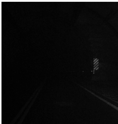
隧道內沒有燈光，黑暗一片的景象