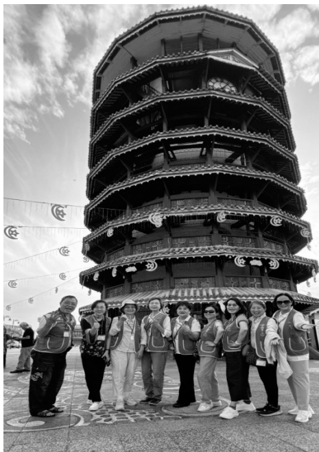
安順斜塔/第2組與分團長副分團長合影