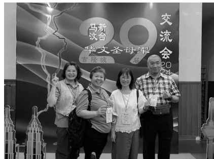
開心與桃園聖母聖心區團合影

激情過後，我們回到台灣，願聖神的領導，讓我們走在成聖的路上，如同此次的標語「成聖自己、聖化他人」。一切榮耀歸於主 阿們。