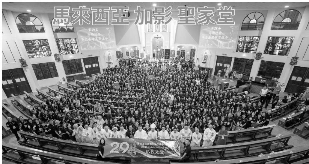
5/31開幕式彌撒後，總主教+教廷大使總主教+11位神父+全體軍友大合影