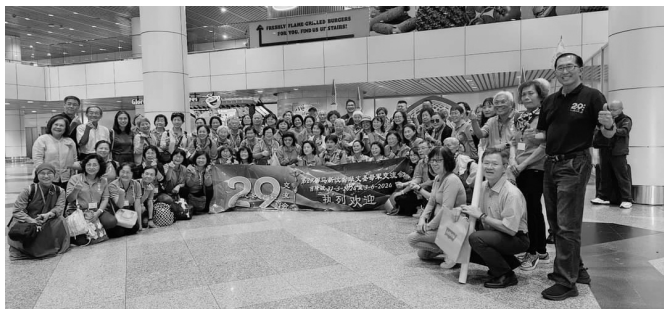
5/28台灣代表團，抵達馬來西亞吉隆坡機場，籌委會主席暨軍友接機合影