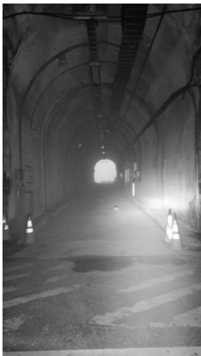
九曲洞隧道裡第一個通風口