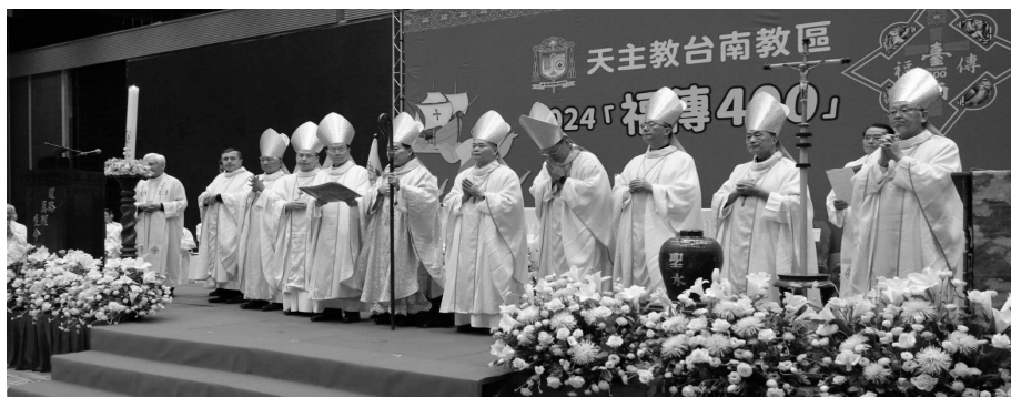
九位主教與教廷駐華代辦

「台南四百 福傳四百」，此次盛典的標誌：台南四百是直的，福傳四百是橫的，一豎一橫形成一個十字；台上有九位主教，加上教廷駐