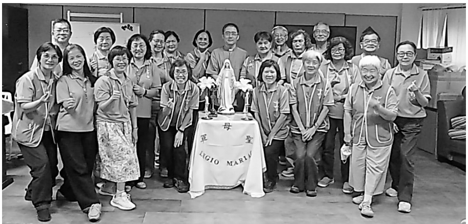
2024年全國通訊員培訓