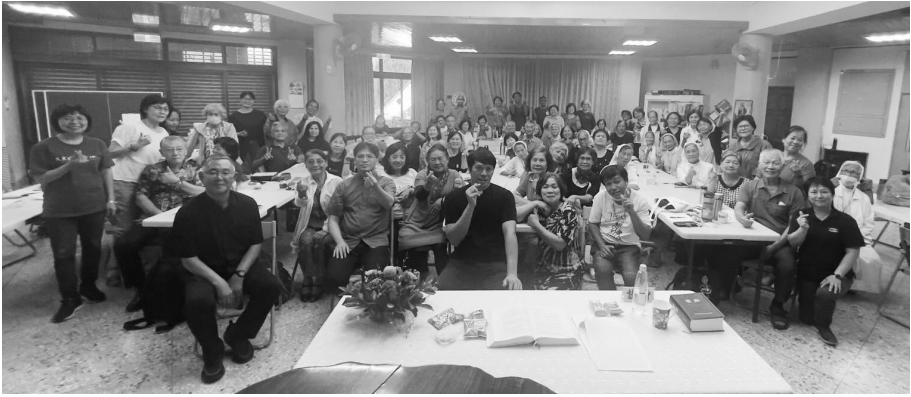
同道偕行、聖體聖事與福傳使命間的關係～靈修講座 大合影

在分辨中找到天主的旨意，在祈禱中聆聽天主、答覆天主、執行天主的旨意；在聆聽、分辨、祈禱、執行天主旨意，建立同道偕行。團體能彼此寬恕、彼此聆聽、彼此關懷、照顧，這就是【同道偕行】。