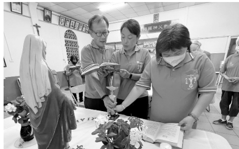
三位職員試驗期滿～手扶軍旗宣誓

宣誓當天，盧神父也提到： 【原本這支團即將面臨解散，心想不要太勉強，而去順從接受天