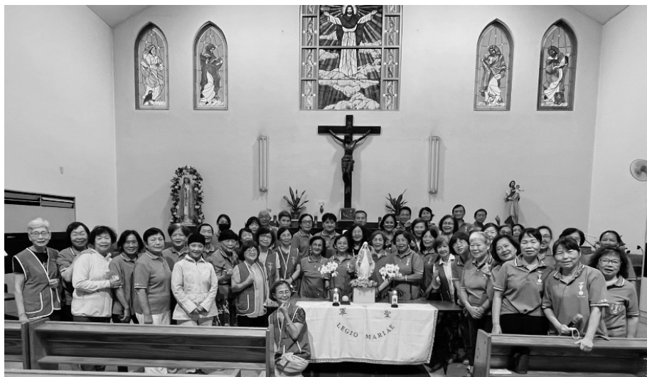
分團職員培訓小組&台南區團培訓職員全體大合照

天雨，及時降到乾旱之地，瞬間得到滋潤。我任職支團秘書約有兩年。初任之際，除了自己摸索外，幸運的是～有資深的前輩們不斷引導，但仍感不足，仍有困惑。譬如說，週會時團員們的工作報告均列入記錄，然而到了年度月會報告時，哪些該報，哪些不該報呢？兩年來還是有些搖擺。又譬如說，聖母軍與堂區之間的關係和互動該如何掌握呢？有時也會有所困惑，有時還絞盡腦汁呢！可憐我的寶貝頭髮，哎呀一去不復返啊！慶幸的是，本堂牧委會與聖母軍之間溝通良好，