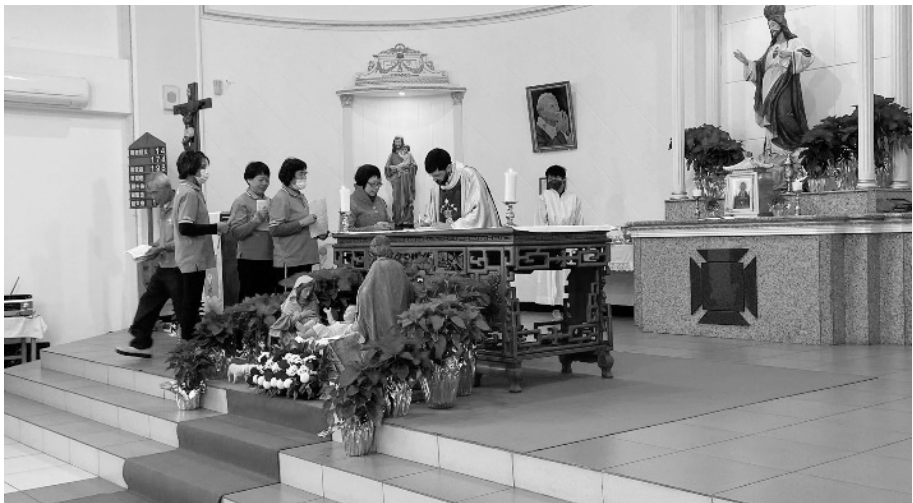
聖母軍是堂區神父的左右手