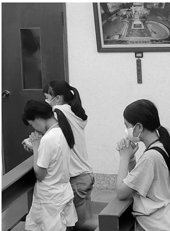
畢業生參加校友「回娘家」活動，在教堂祈禱

然而邀請年輕人服務「祈禱學校」，其實也是對他們的靈修培育～營隊中，他們每天可以望彌撒、祈禱，也可以領受和好聖事，可以算是他們一