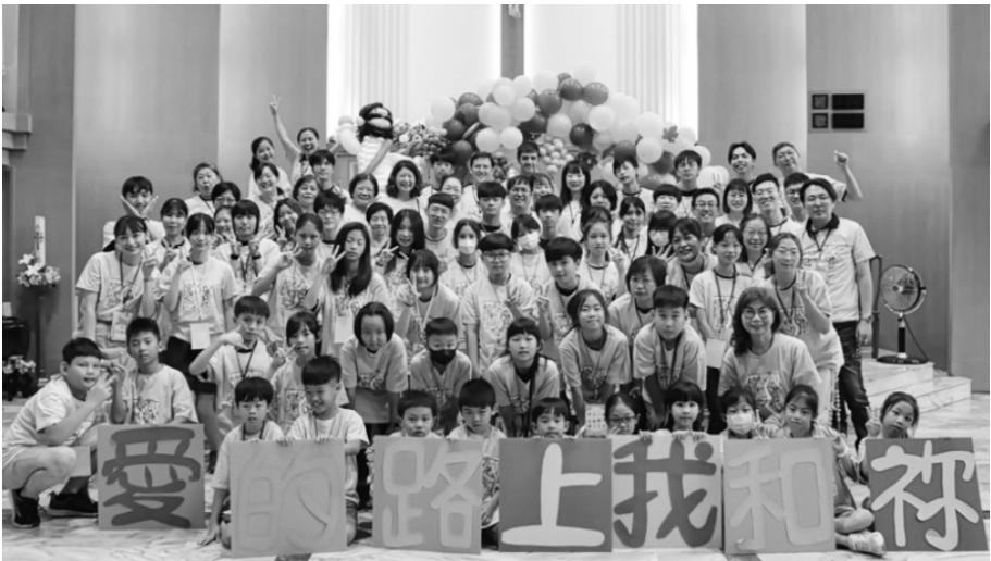
2024年新莊聖保祿堂第25屆夏令營《愛的路上我和祢》