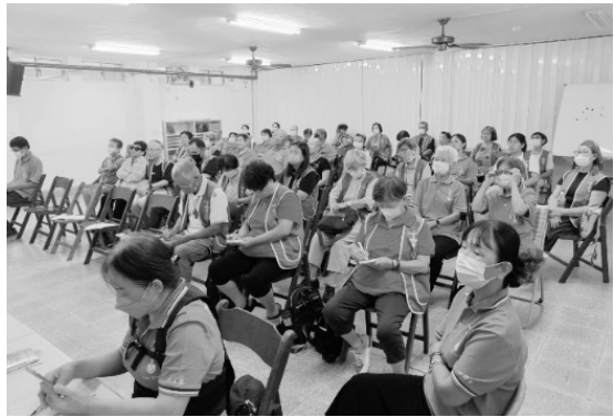
區團所轄所有支團職員一起培訓

在這次的聖母軍職員培訓中，我們不僅深入了解了聖母軍的創辦人及其理念，還詳細探討了組織結構和各職位的職責。這次培訓對我來說，不僅是知識上的提升，更是對信仰的加深體會。以下是我對這次培訓的心得總結。