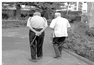
退休神父們靜居散步祈禱

我出生 2 個月即領洗，領洗後的我，稱不上是好教友，但生活上也期許自己能成為一個天主所喜悅的孩子，耶穌受洗也使我對自己受洗的勉勵期許，我對自己受洗承諾力行有三：