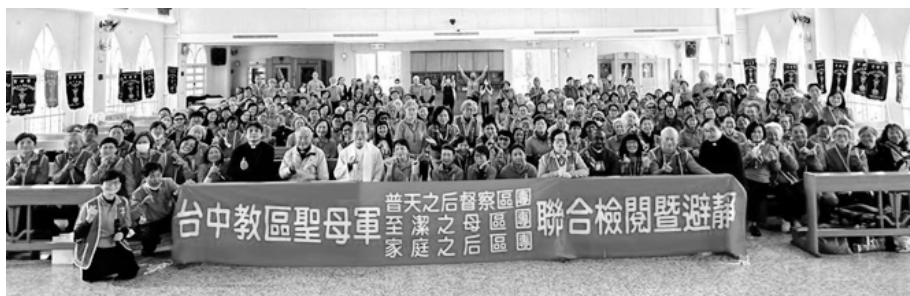
2025 年聯合檢閱暨避靜 台中普天之后督察區團+至潔之母區團+家庭之后區團