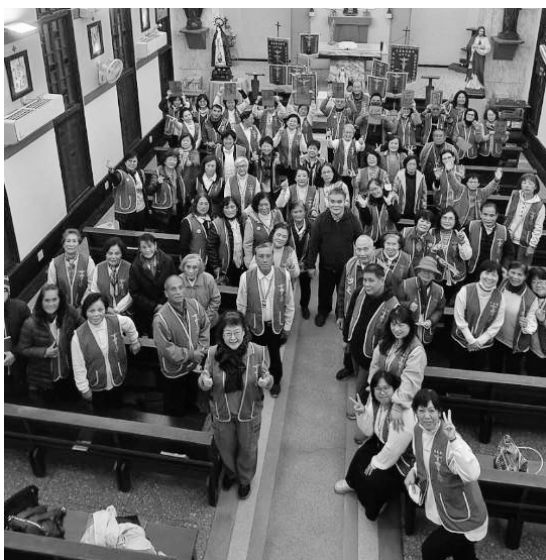
基隆諸惠中保區團檢閱 2025.03.08 基隆耶穌聖心堂