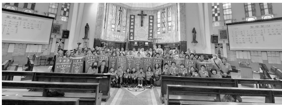
西新竹宗徒之后區團 檢閱 2025.03.15 北大路主教座堂