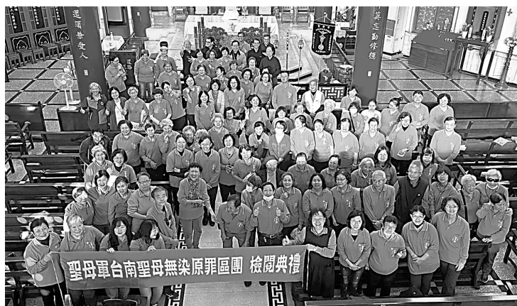
台南教區 2025.03.09 台南聖母無染原罪區團 檢閱大典 徒步朝聖至台南主教座堂