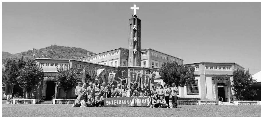
花蓮結約之櫃區團檢閱 2025.03.22 富田天主堂