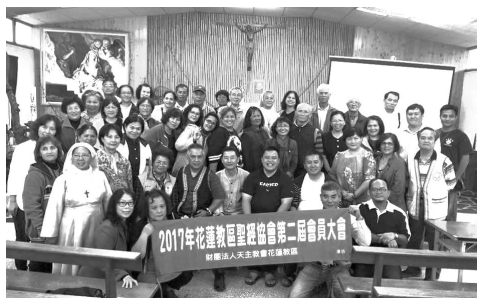
大家歡喜來讀經 聽聖言 行主旨

更要感謝 12 年來在花蓮教區聖經協會 / 聖經講座教授神師們 - 陳春光副主教、劉振忠總主教、許達士神父、黃文科神父、劉一峰神父、林貴明神父、費奕峰神父，葉元良神父、林志銘神父等；特別感謝我敬愛的讀經班神師 - 史成勇蒙席、段泰平神父、吳若望修女、蘇秀美修女、樂俊仁神父、朴圭雨神父、杜晉善神父、崔寶臣校長等。願光榮歸於父及子及聖神，起初如何，今日亦然，直到永遠，阿們！