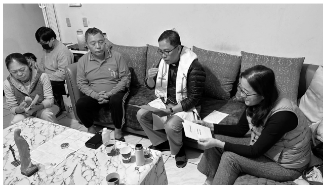
唐家德神父在第一時間，就來家裡探望我