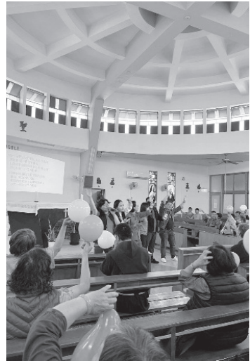
聯合堂區避靜 祝福活動

神父接著說，有沒有教友：因為不喜歡本堂的這個神父，而離開這個教堂去別的教堂望彌撒的，可能有這種情形！可是教友選擇離開是很容易的，但是神父無法離開，神父在本堂，有長上給的命令，必須努力去做，努力做也不一定會做得完美，因為一定有一個限度，無法