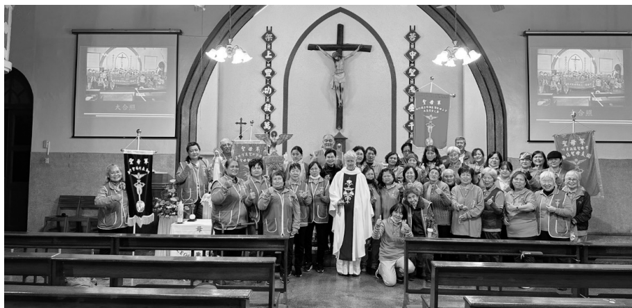
東新竹瑪利亞區團 檢閱 2025.03.15 竹東無玷聖母堂