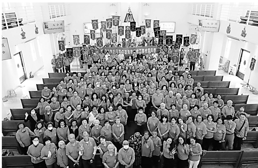
◎高雄教區 高雄海星督察區團聯合轄下三區團：瓜達露貝區團、 上智之座區團、病人之痊區團，檢閱大典大合影（260人）