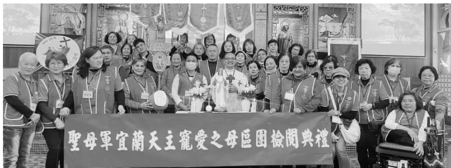
宜蘭天主寵愛之母區團檢閱 2025.03.22 蘇澳天主堂