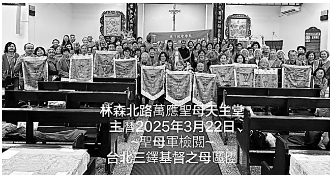
林森北路萬應聖母天主堂 主曆2025年3月22日 聖母軍檢閱 台北三鐸基督之母區團