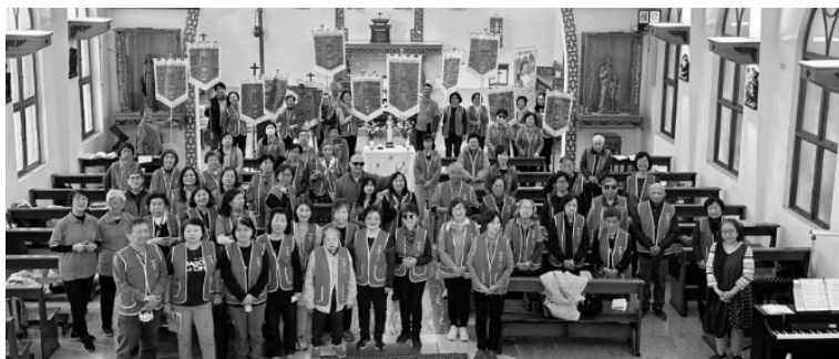
台北四鐸顯靈聖牌聖母區團檢閱 2025.03.22 士林天主堂