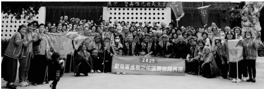
台東 進教之佑區團檢閱典禮 2025.3.8 東河天主堂