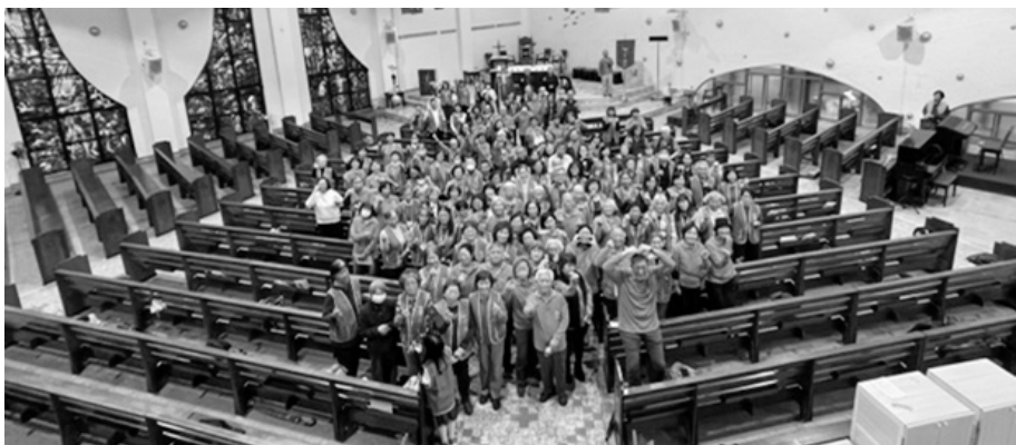
台北玄義玫瑰區團 03/15 檢閱 166 位團員大坪林聖三堂