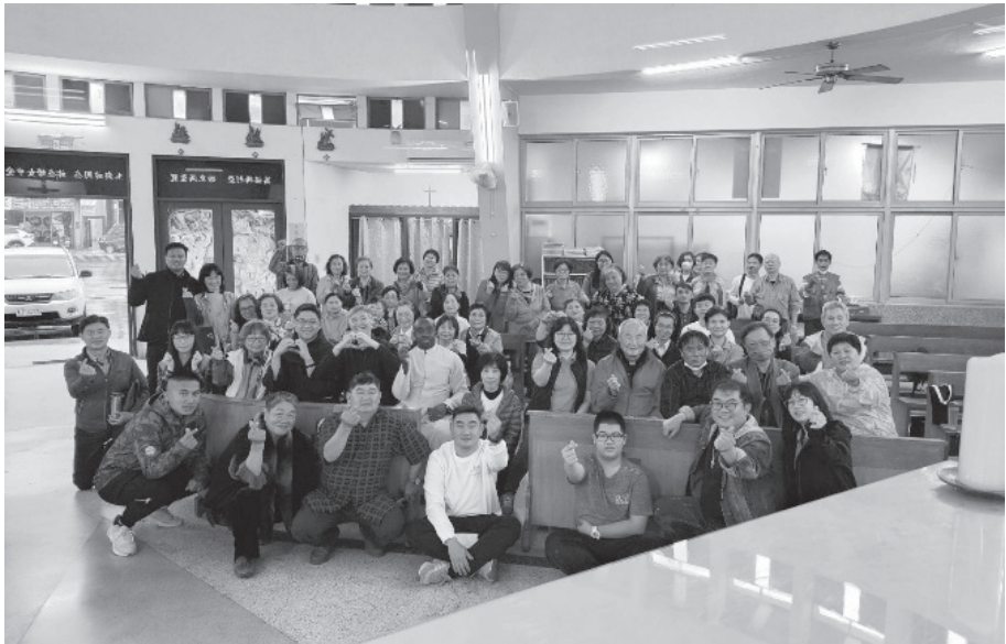
聯合堂區 四旬期避靜大合影

※※※ 其實，碰到了這個情形，我們就要用方法，我們可以跟神父說：「神父你的提議很好，但是【聖週五我們要守大小齋】，我們改到復活節過後～再吃好嗎！」，用「勸勉與關懷的心」，讓一切回到愛德中！然後照【教會】的規定，守大小齋，繼續在愛德關懷中與神父不分離，回到正確的做法，這個例子就是教大家用關懷勸勉的方式，做好【真正的完美的服從】。(待續～ 55 期軍刊)