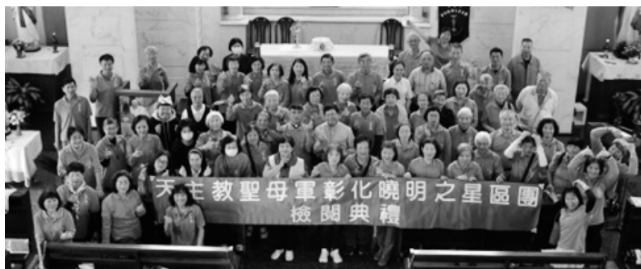
彰化曉明之星區團檢閱