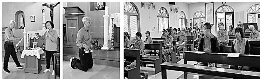
高雄海星督察區團講解示範彌撒禮儀：輔祭人員