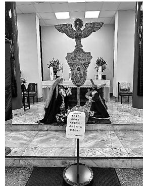
台北三鐸基督之母區團 新大軍旗

確實，計畫永遠趕不上變化，尤其又會面臨諸多變數～無論如何，我們全心全意信靠我們的母親：「我的母皇，我的母親，我全屬於妳，我所有的一切都屬於妳」。聖母永遠會為我們～向她的親子代禱轉求。阿們！