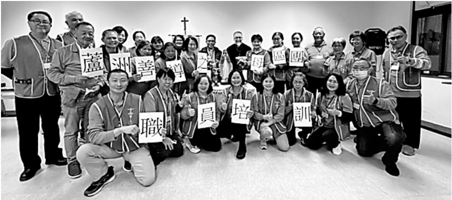
台北教區 蘆洲善導之母區團 職員培訓後大合影2025.2.15 心得感受：本次職員培訓，好似每年一度的<全國區團職員會議>縮影。