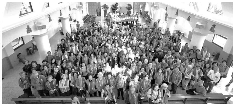
嘉義教區 2025.03.23 嘉義在天中國之后區團+雲林諸龍中保區團 聯合檢閱大典 梅山天主堂