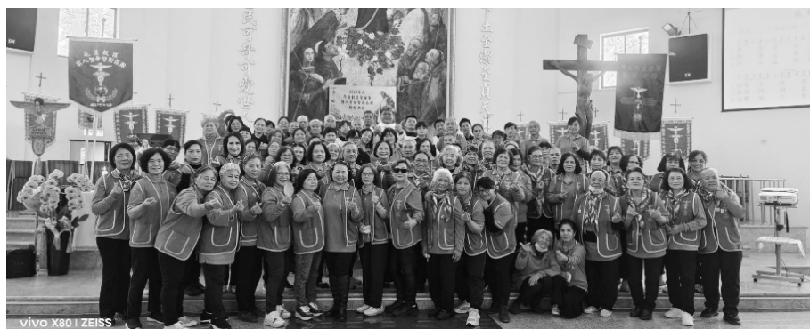
花蓮窮人聖母督察區團檢閱 2025.03.29 花蓮主教座堂