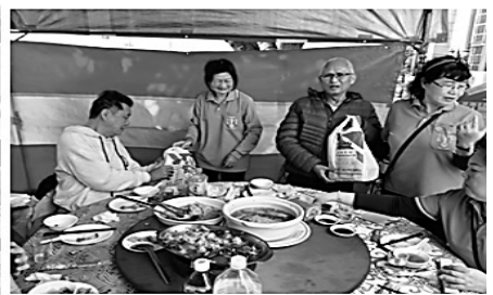
劉總主教、道明會士修女、林神師、TVBS關懷戶、教友&聖母軍共融