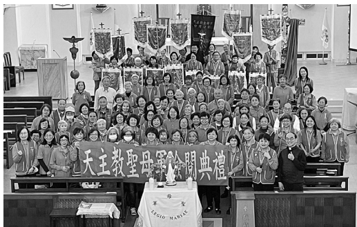
台灣分團檢閱大典 2025.03.22 台北聖母無原罪主教座堂

感謝天主！多麼令人歡欣雀躍，我們圓滿、成功地完成了聖母軍 2025 年的檢閱禮！