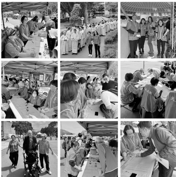
報到組一二三組(七教區教友神父修女)+ 國璽組(神父祭衣)+場內組

祝福趙永吉主教得自天主聖神賜予喜樂與智慧，成為鍾總主教最佳的左右手，與全體同仁們攜手同心，使牧靈福傳工作更加順利、中悅天主，讓天主的愛被社會大眾所看見，讓天主的國在地上實現。