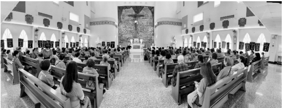
台中教區 普天之后督察區團+至潔之母區團+家庭之后區團聯合檢閱暨避靜

聖母軍是個靈性家庭，該彼此支持不讓任何人感到孤單，每次周會時，看看我們的支團有沒有家庭的感情？團員之間有沒有彼此衝突？每次開完會就走，少了彼此的情誼，沒有家庭的氣氛，因此，支團不會發展，這方面我們要檢討，聖母軍是個靈性家庭，彼此支持是不讓任何人感到孤獨，若有團員感到沮喪，應該關心、鼓勵、陪伴，成為希望的橋樑，參加周會、避靜、檢閱不僅是履行義務，更是讓我們在團體中吸取希望的力量。( 待續～ 55 期軍刊 )