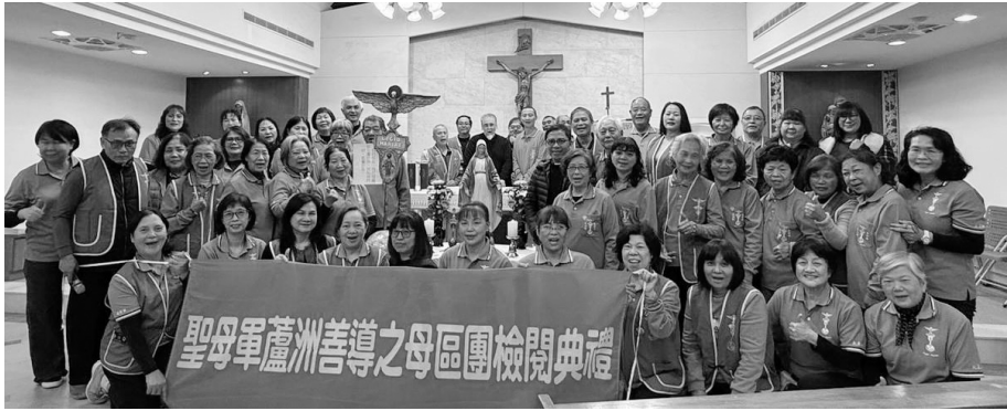
台北蘆洲 善導之母區團檢閱典禮 2025.03.08 聖若瑟天主堂